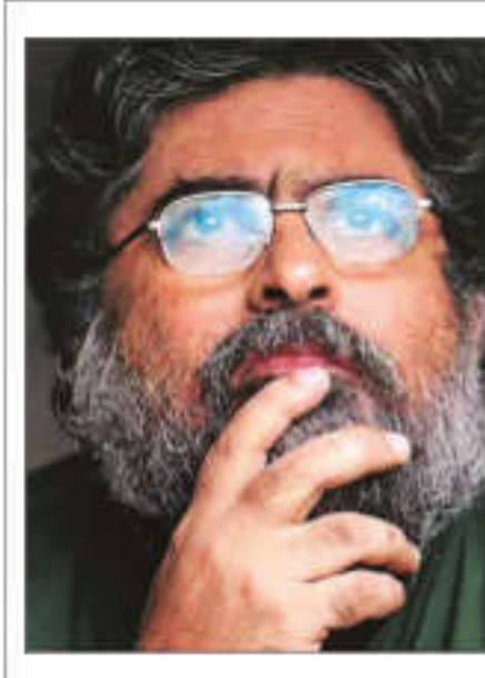
VALMIK THAPAR 1952-2025

That was also the year I started learning the mercurial ways of India's Tiger Man. Thapar was warmly supportive of my work in The Indian Express from the day I first reported the total loss of tigers in Rajasthan's Sariska tiger reserve in January 2005. He offered me encouragement,